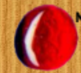
металическо червено 03GB