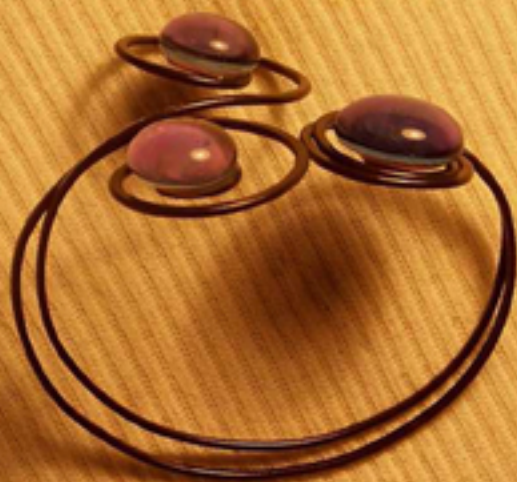
гривна с 3 камъка 52 лв. - във всички цветове