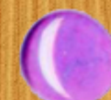
светло лилаво 09B