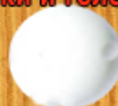
непрозрачно бяло 02B