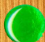
тъмно зелено 07B