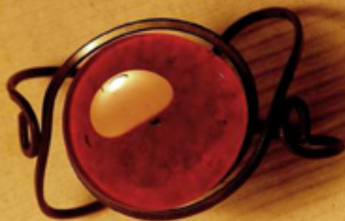
гривна с 1 камък 52 лв. - във всички цветове