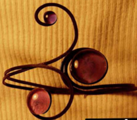
гривна с 3 камъка 52 лв. - във всички цветове