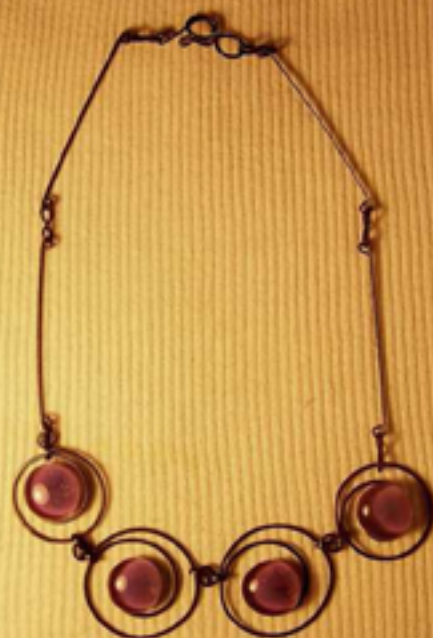
68 лв. колие с 4 камъка