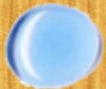
светло синьо 06A