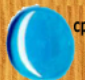
средно синьо 05MB