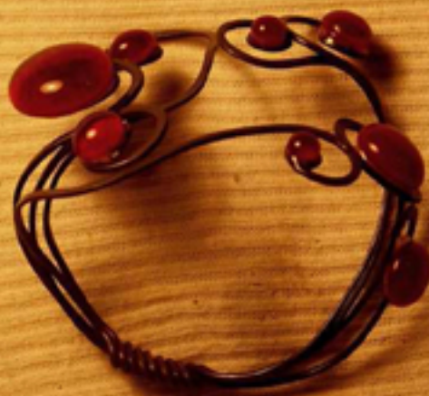
ексклузивна гривна 100 лв. - във всички цветове