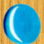
средно синьо 05MA