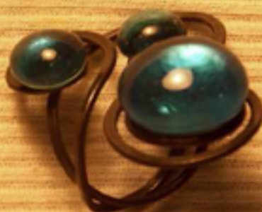
52лв. - пръстени с 3 камъка ПЛЕКСО