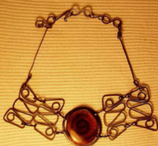
80лв. колие пеперуда