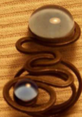
40лв. - пръстени с 2 камъка СЕРПЕНТИНА