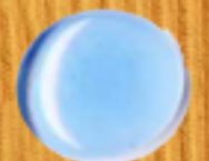
светло синьо 06B