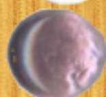
металическо лилаво 17GA