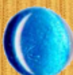
металическо синьо 05A