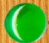
светло зелено 08B