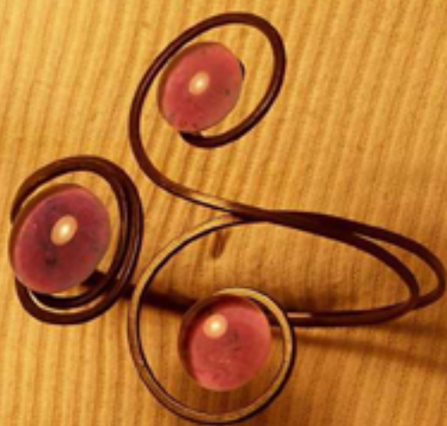
гривна с 3 камъка 52 лв. - във всички цветове