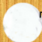
прозрачно бяло 02TA