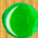
тъмно зелено 07A