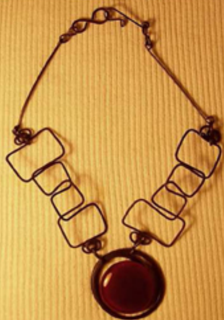
68 лв. увито колие