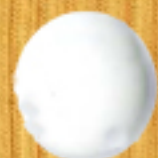
непрозрачно бяло 02A