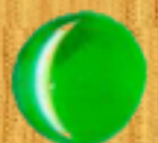
светло зелено 08A