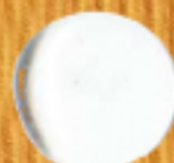
прозрачно бяло 02TB