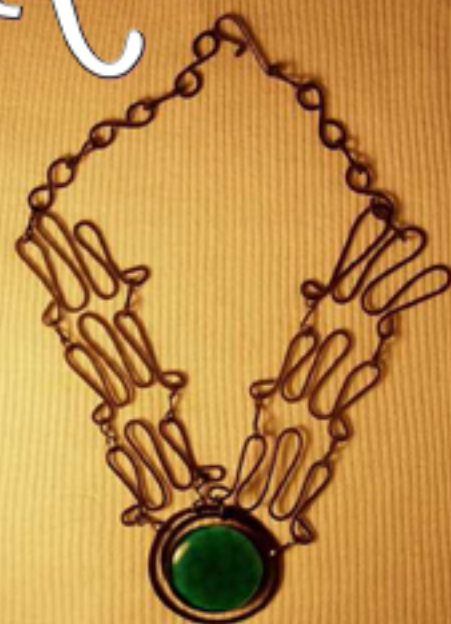
80лв. колие серпентина