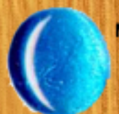
металическо синьо 05B