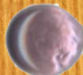
металическо лилаво 17B